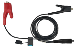
1 x JACK CC Macho De 2m Con Pinza De Cocodrilo 371000