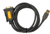
1 x Cable Convertidor DB9 Hembra A USB Tipo A Macho 317000