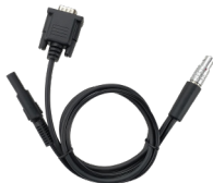
1 x Cable De Configuración Para Radio Externa ACC041 ACC102