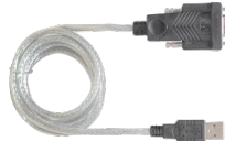
1 x Cable Convertidor DB9 Hembra A USB Tipo A Macho ACC015

[1] El modelo del cable se entregará según los requisitos del cliente: