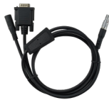
1 x Cable Serial De 5 Pines a DC JACK Y DB9 Macho 157000